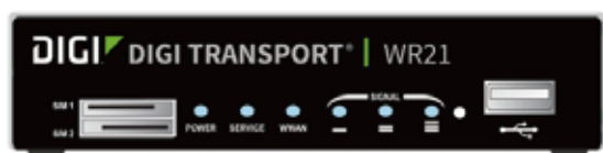
WR21 - FRONT