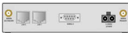
WR21 - RS-232/422/485 Models