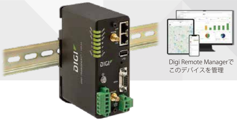
Digi Remote Managerでこのデバイスを管理